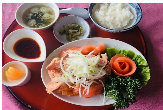
仙台森林油淋鶏 1,650円